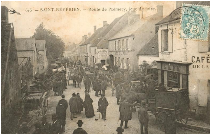
616 – Saint Révérien - Route de Prémery, jour de Foire (1906)

Lorsque nous comparons la vie et les activités des commerces de Saint Révérien d'hier et d'aujourd'hui, nous nous apercevons que cela a bien changé en un siècle.