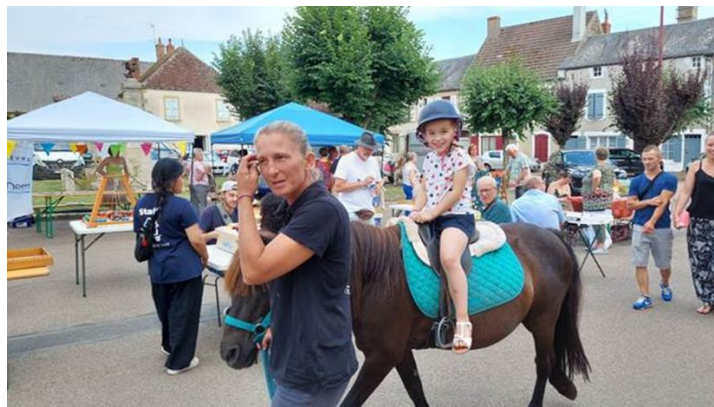
Promenades à cheval avec le centre équestre de Chanteloup