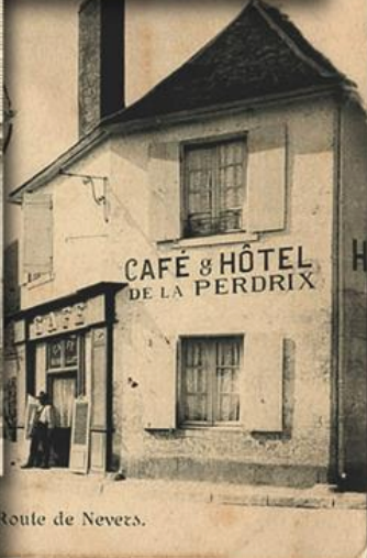
Roule de Nevers.