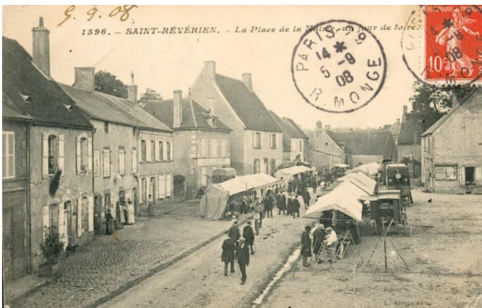
1596 – Saint Révérien - Place de la mairie un jour de foire (1908)

En 1901, chaque façade était un commerce ou un artisan, on ne décomptait pas moins de :