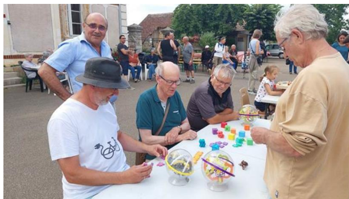
Jeux de sociétés et casses têtes bien difficiles