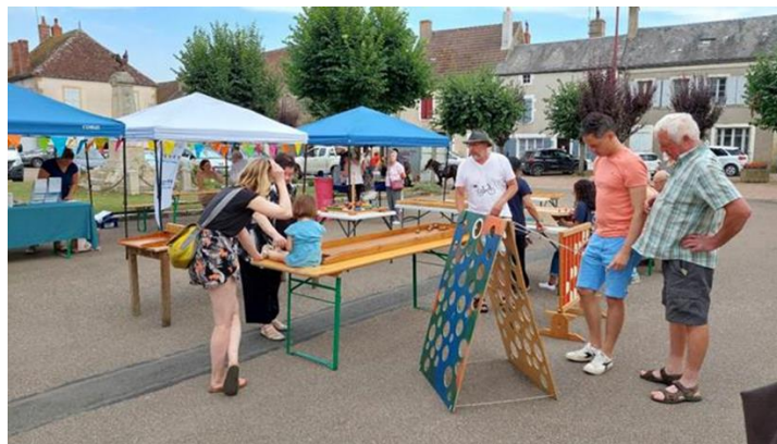
Jeux XXL avec la Ludothèque de Lormes

Une bonne centaine de personnes sont venues voir, s'informer, participer aux activités ludiques et diner sur la place de la mairie.