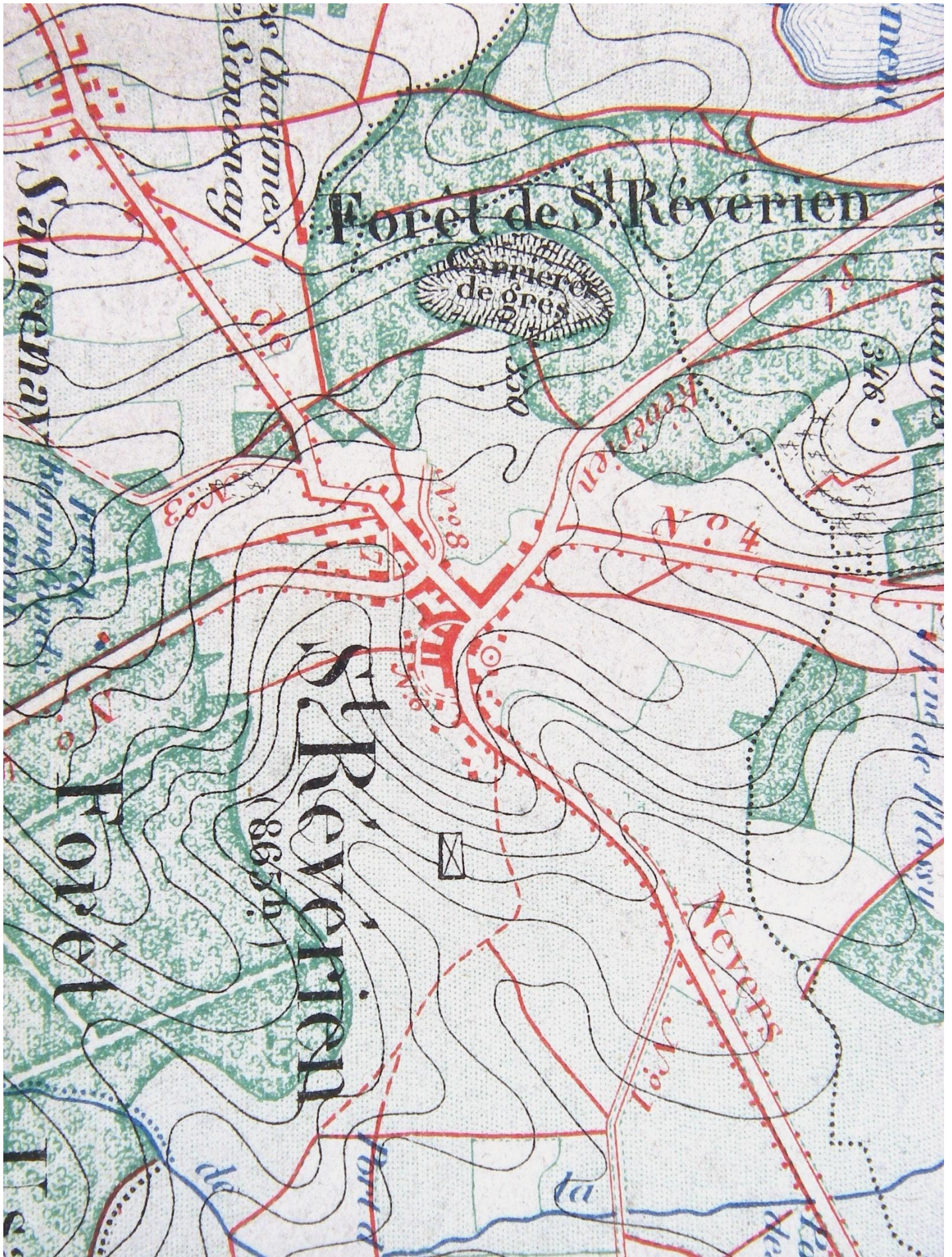
Carte géographique du Canton de Brinon en 1878. Commune de Saint Révérien, le Bourg.