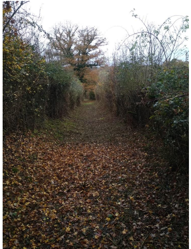
Les chemins non mécanisables sont entretenus par le chantier d'insertion.