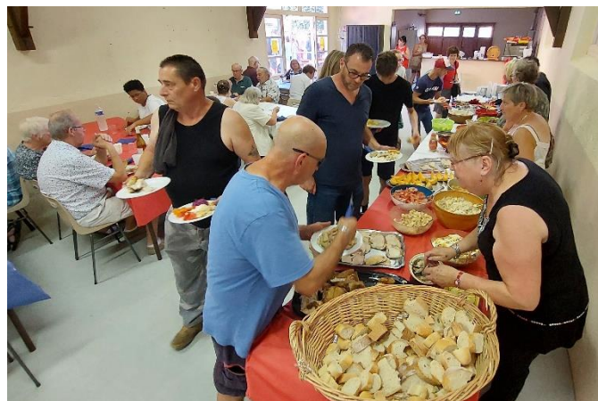
Buffet froid lors du repas républicain du 14 juillet.

Les membres de la commission Fêtes et Cérémonies remercient tous ceux qui nous ont aidés pour mener à bien ces manifestations.