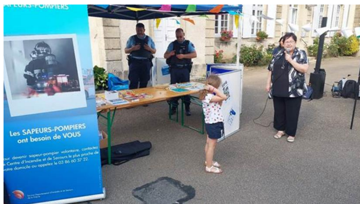
Madame le maire faisant son discours de bienvenue