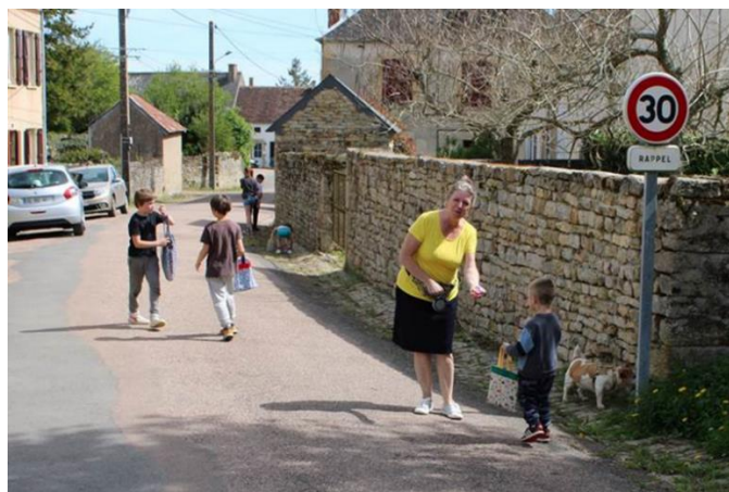
Ça continue rue de la Mallette...