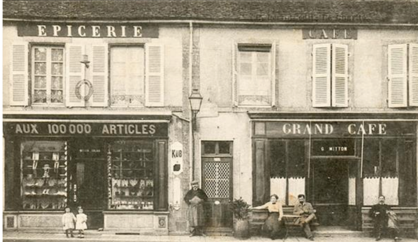
SAINT-REVERIEN (Nièvre) — Un Coin du Bourg — La Maison Mitton