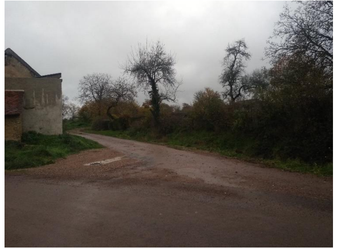
Aménagement du carrefour aux Angles

En souhaitant que cet appareil reste le plus souvent possible au chaud dans sa boîte.