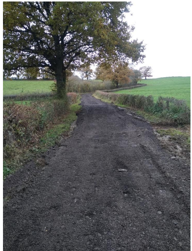
Chemin remblayé avec le fraisât.