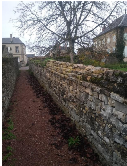
Une partie du mur du presbytère remonté.